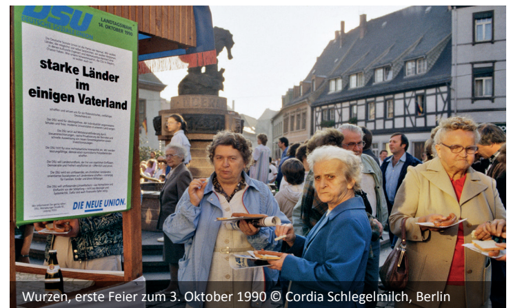
Wurzen, erste Feier zum 3. Oktober 1990

Die weitere Entwicklung der Mittelstadt Wurzen hat infolge von Wirtschaftskrisen, Weltkriegen und Diktaturen starke Umbrüche durchlaufen, hat zu Identitätskrisen geführt. Die Vielfalt dieser Stadt, die je nach Kontext als Muldestadt, ehemalige Bischofs- und Residenzstadt, Industrie- und Arbeiterstadt und überregional vor allem als Ringelnetzstadt beworben wird, ist zukunftsstiftendes Potential. Die Ausstellung will dazu anregen, darüber ins Gespräch zu kommen, sich zu fragen: Was machen die Stadt und ihr Bild aus? Wofür will sie bekannt sein? Welchen Ruf hat sie bei ihren Bewohnern, ihren Besuchern?