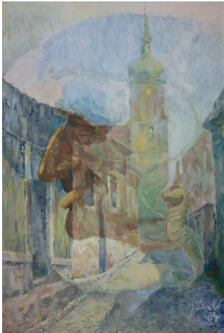
Johannes Pätzold, Ringelnetz in Wurzen, Ölgemälde, 1984

Städte sind in den meisten Fällen – so auch die Stadt Wurzen – gewachsene räumliche Gebilde. Seit jeher sind sie Schauplatz und Resultat von ebenso komplexem wie umkämpftem Wandel. Denn jede gesellschaftliche Entwicklung hinterlässt ihre Spuren im urbanen Organismus. Als Projektionsfläche vielfältiger Wirklichkeitsdeutungen und Visionen stiften Städte Identität. Als kommunikative Konstruktion bilden sie den Kern der Stadtkultur und stehen im Bezug zu ihren Bewohnern. Im Gesamtbild des oft willkürlich und zufällig wirkenden Lebensraums manifestieren sich Abfolgen von Veränderungen gegenwärtiger und zukünftiger Trends in Gesellschaft, Kultur und Wirtschaft. Um sich zu orientieren, um heimisch zu werden, bedarf es der Eingewöhnung. Das braucht Zeit.