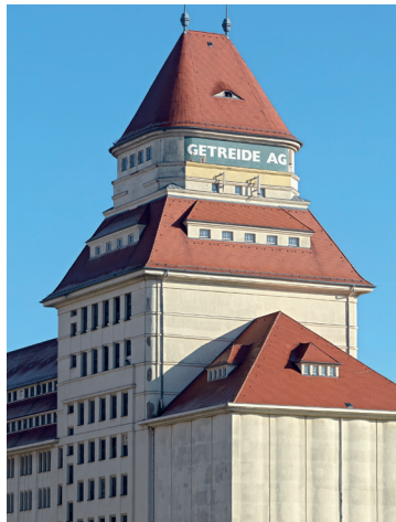
Wurzener Nahrungsmittel GmbH, Mühlenturm der ehemaligen Krietschwerke, 2013

Bezogen auf die Stadt Wurzen, die auf eine über 1050-jährige sehr wechselvolle Geschichte zurückblicken kann, geht die Präsentation exemplarisch der Herausbildung und Entwicklung ihrer Stadtbilder, ihres Images nach.